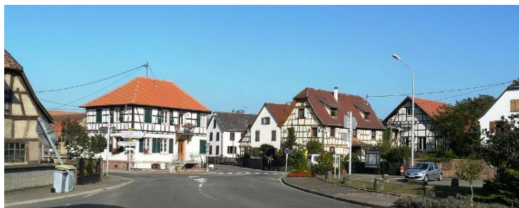
Centre-bourg de Baldenheim