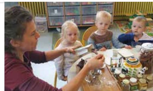
Confection de thé et de tisane grâce à l'intervention des Jardins de Gaïa