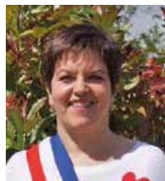
Virginie MUHR Maire